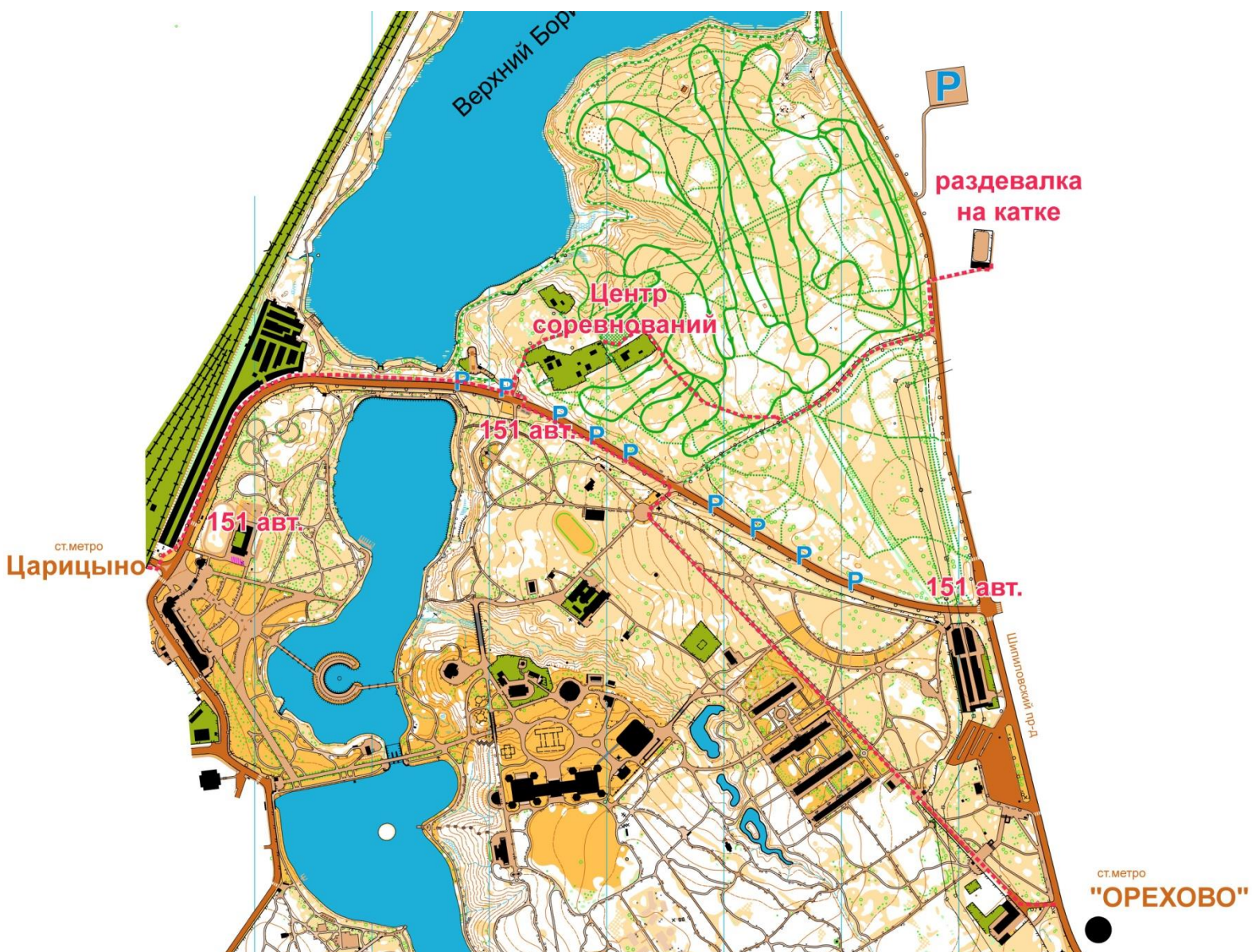
Схема проезда и парковки

Заявку необходимо подать через систему онлайн на сайте www.sportvokrug.ru/competitions/5152/ строго до вторника 5 февраля (до 24:00 часов) !